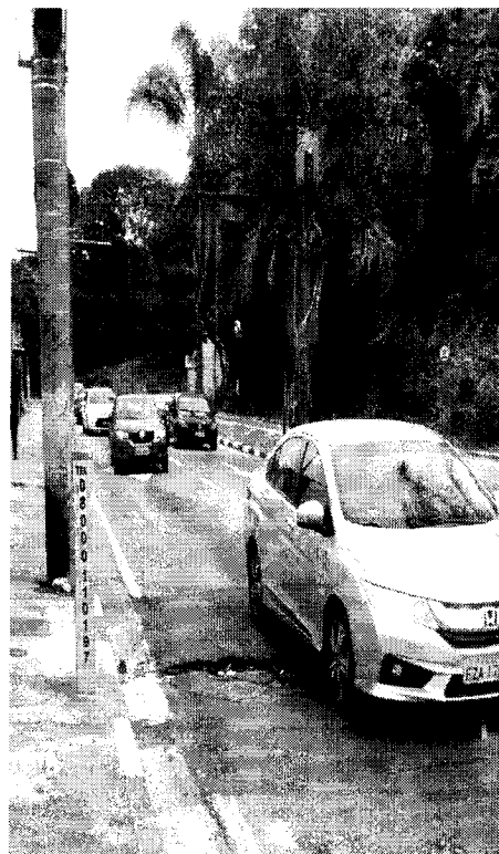
MANUTEÇÃO ASFÁ LTICA- na Av Lothar Waldemar Hoehne – 1112 - Ponte grande, Mogi das Cruzes.